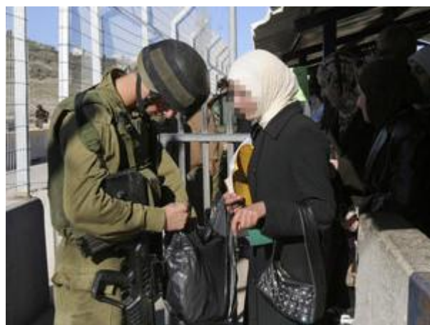
חייל בודק פלסטינית במחסום. ראינו מה שעמום יכול לעשות

וראינו כבר מה עלולים לעשות כשהשעמום גובר - מהתייחסות מחפירה במחסום לפלסטינים עד כדי התעללות ועד חיפוף בדיקות במחסום – דבר שעלול להסתיים בפיגוע בליל הסדר באחד מבתי המלון במרכז.