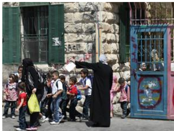
תלמידים פלסטיניים במזרח ירושלים

בדיון שהתקיים הבוקר (ג') בוועדת החינוך של הכנסת עלה כי בירושלים ישנם כ-20 אלף תלמידים פלסטיניים אשר החומר שהם לומדים לא עובר פיקוח של מנהלת החינוך בעיר. מדובר בתלמידים בגילאי גן עד תיכון שמוגדרים כלומדים בחינוך מוכר שאינו רשמי. יו"ר הוועדה אלכס מילר (ישראל ביתנו): "מנהל בית ספר אשר במוסד החינוכי אותו הוא מנהל נלמדים תכנים מסיתים, צריך לשאת באחריות פלילית".